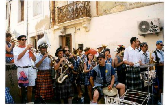
Les Kadors en 1999