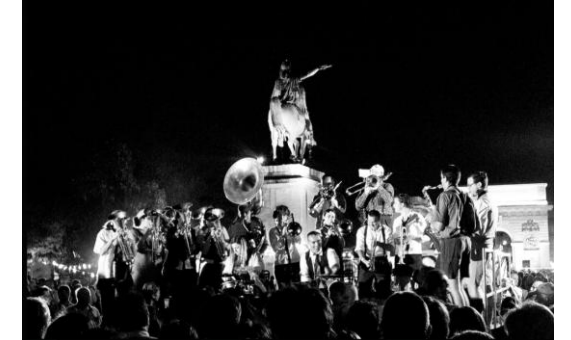
2005: pour ses 10 ans , au Peyrou